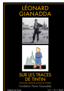
Photos: Editions Albin Michel, Editions La Découverte, Martha's Music, Herge-Tintinmaginatio 2024-Vallée des Rois-Egypte-1960/PPG, Herge-Tintinmaginatio 2024/PPG, LAFF Festival, Editions Slatkine, Avenches Tattoo, Les Digitales, Théâtre du Jorat, 31 e Fête du livre

«Léonard Gianadda sur les traces de Tintin», jusqu'au 19 novembre 2024, Fondation Gianadda, Martigny, gianadda.ch